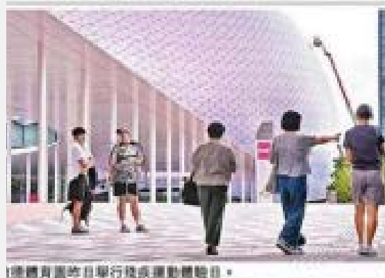
體藝館昨日舉行殘疾運動體驗。