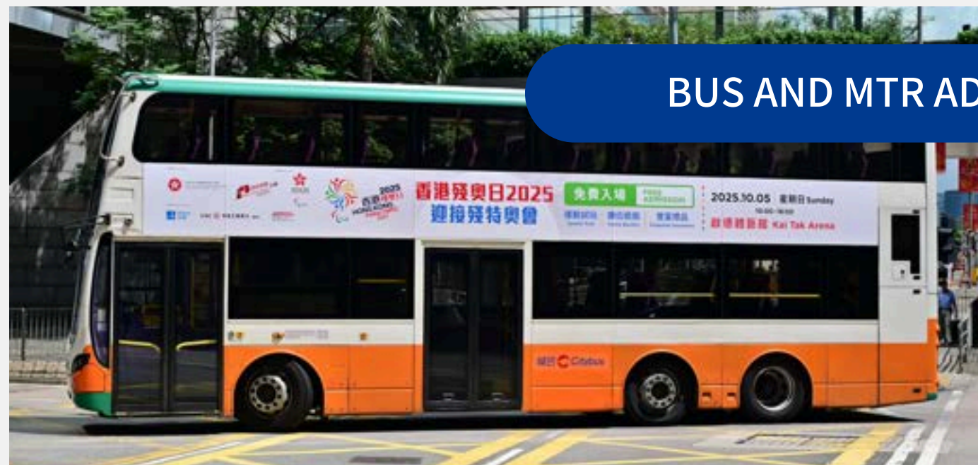
BUS AND MTR ADS